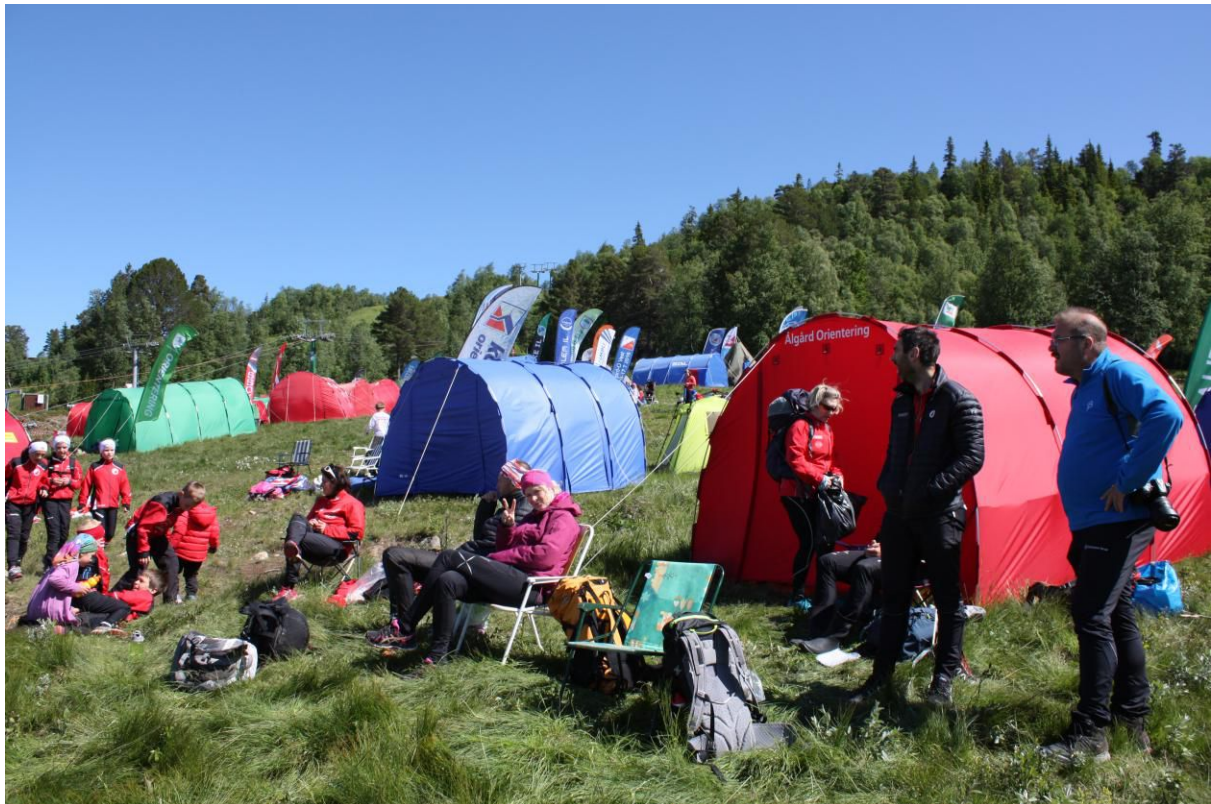
Samlingsplass ved Rauland Skisenter.

Sørlandsgaloppen på Rauland ble en suksess med mange familier som var med! Nye vennskap ble knyttet og det sosiale miljøet styrket. I tillegg fikk en flotte opplevelser og godt kjennskap til myggen...!