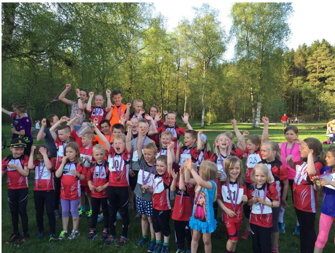
Gjengen fra Ålgård Orientering som deltok på lagkonkurranse i Vagleskogen 10. mai 2016.

10. september arrangerte ÅO o-troll leir for 8-13 åringer ved klubbhuset til Gjesdal IL på Solås. Deltakerne var fra ÅO, Sandnes, Egersund og Ganddal. Etter 1. økt hadde vi lunsjpause og quiz, og etter 2. økt ble det servert pizza. Dette var en leir uten overnatting, med 23 unger fra ÅO. God innsats fra foreldre i klubben vår som hjalp til på kjøkkenet og rydding og utvask ble gjort i en fei siden så mange bidro!